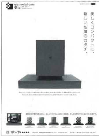
メモリアルケース「夢SO」のポスター