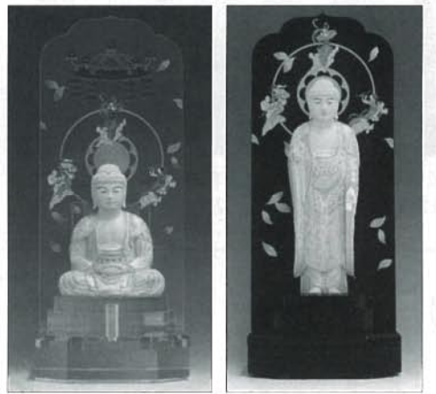
新世紀位牌「彩り」アクリル蓮台シリーズ (こもりコーポレーション)

「優雅鳳凰」が登場。金粉と光彩粉を使用した加賀時絵を施し、現代的な形状の中に和のテイストを融合、位牌の台座に鳳凰の絵柄が描かれている。鳳凰は再生の象徴として信仰されている伝説の鳥で故人の魂を守り、極楽浄土に導くといわれ、世界遺産・平等院鳳凰堂、金閣寺をはじめ、多くの文化財や装飾に使われている。四機種が揃っており、「なでしこ」「やまと」は鳳凰が一羽、「おしどり」「回出タイプ」は鳳凰が二羽描かれている。