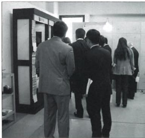
ずゞや展示会で大きな注目を集めた