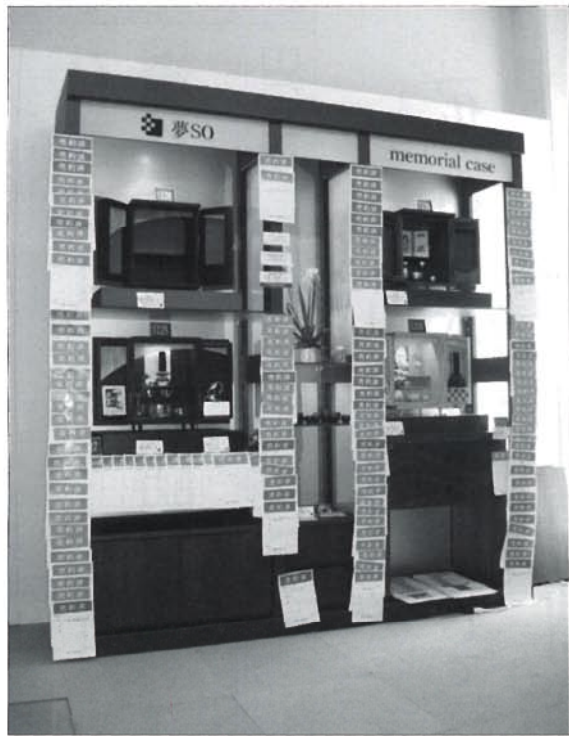
ずゞや展示会最終日には数多くの売約済みの札

るという。メモリアルケース「夢SO」は意匠登録済(第1397533号)で、不当な値引き競争を避けるために小売価格が設定されている。